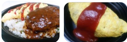
オムレツピラフ オムライス(ケチャップ)