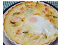
リゾット風エッグドリア 1-2人分