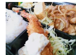
豚生姜焼き + エビフライ 弁当