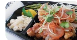
からあげマリネ 弁当