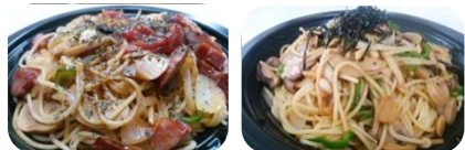
Tosオリジナル きのご和風