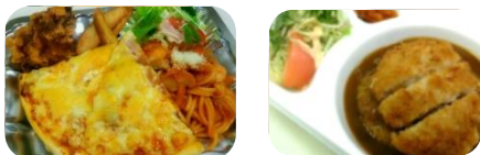
ピザ & パスタSet ミニ カツカレー ¥550