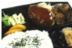
ハンバーグ&牛サイコロ