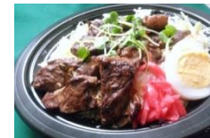
牛サイコロステーキ丼