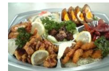
パーティーオードブル B ¥4320 サンドイッチ 要予約 ¥700より/1人