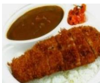
豚ロースカツカレー

手づくり弁当 : 会議弁当、特注弁当 1個 ¥540より ご予約承ります。(100個まで) お客様のご予算に応じてお作りいたします。 お気軽にご相談ください。 042-524-2508