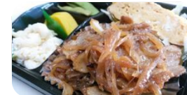
豚バラ生姜焼き 弁当