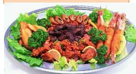
パーティーオードブル A ¥3240