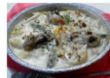
カキグラタン 1-2人分