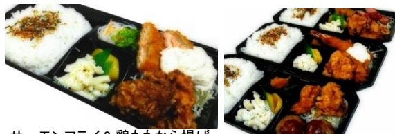
サーモンフライ&鶏ももから揚げ